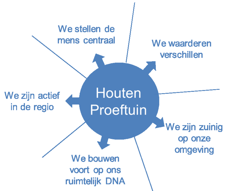
Figuur 3. Vijf veranderprincipes voor Houten Proeftuin

In dit hoofdstuk lichten we deze vijf principes toe. Daarbij gebruiken we voorbeelden ter inspiratie over hoe Houten er in 2025 uit zou kunnen zien. We willen hiermee de toekomst meer tastbaar maken. De gegeven voorbeelden hebben een zeker realiteitsgehalte, in die zin dat hier mogelijk kansen liggen. Maar we willen niet pretenderen dat Houten er in 2025 echt zo uit ziet. Op weg naar 2025 kunnen ook andere keuzes worden gemaakt. De vijf principes die ten grondslag liggen aan de te maken keuzes staan echter wel vast.