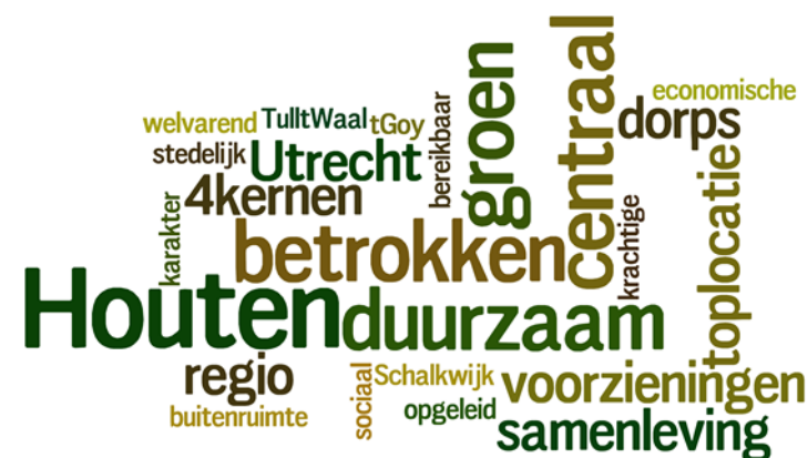
Figuur 1. Het Houtens DNA

groeitaak van Houten zit er zo goed als op, grote uitbreidingen liggen niet meer in het verschiet. Houten moet zich aanpassen, wil zij ook in de toekomst een prettige gemeente voor haar inwoners zijn.