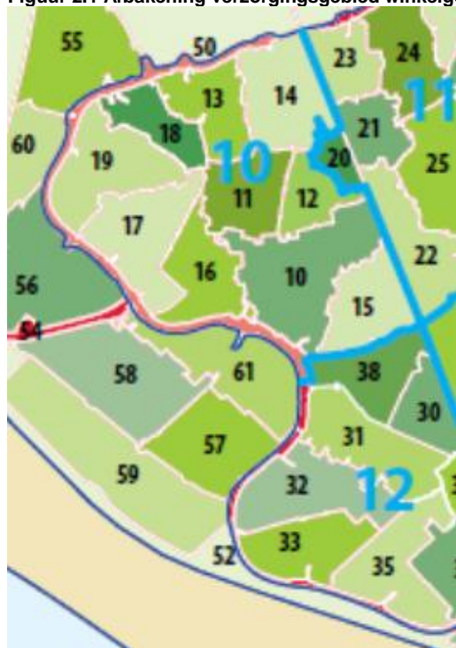
Figuur 2.1 Afbakening verzorgingsgebied winkelgebied Oude Dorp 2020

In figuur 2.1 is aangegeven welke buurten (en bedrijventerreinen) tot het verzorgingsgebied van het winkelgebied Oude Dorp worden gerekend. In dit gebied woonden in 2019 circa 19.635 inwoners. Het verzorgingsgebied is afgebakend met behulp van omzetherkomstgegevens van Albert Heijn en van andere ondernemers in het Oude Dorp. Het bevolkingsdraagvlak van bijna 20.000 inwoners is voldoende voor een met name wijkverzorgend winkelcentrum. Het bevolkingsdraagvlak van de wijkverzorgende winkelcentra in ons land varieert tussen de 10.000 en 30.000 inwoners.