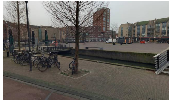
Locatie K, vaste beplanting