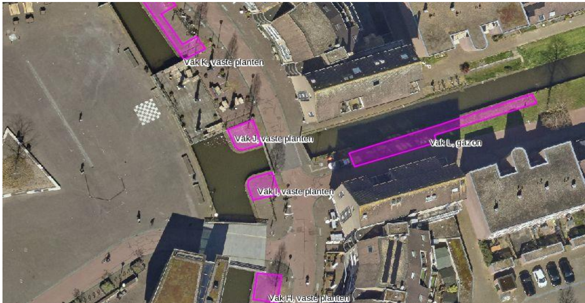
Overzicht te ontstenen locaties aan Het Rond en Kooikerseind