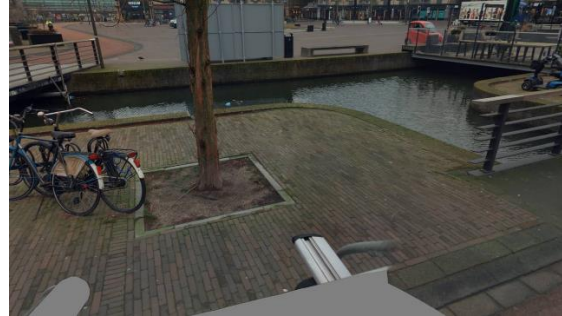
Locatie I, vaste beplanting