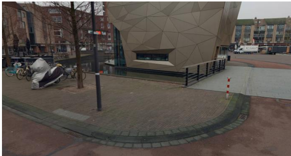
Locatie H, vaste beplanting