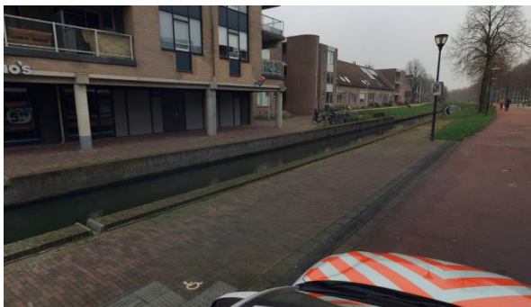
Locatie L, gazon