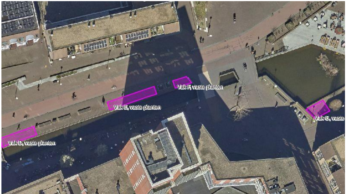
Situatie te ontsteden locaties het Onderdoor-oost, Het Rond