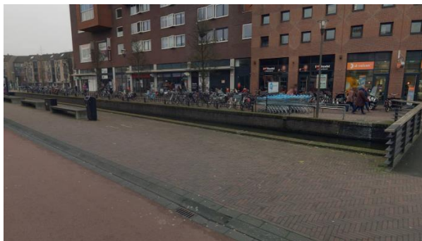
Locatie D, vaste beplanting