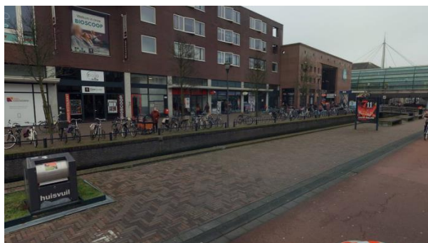
Locatie E, vaste beplanting