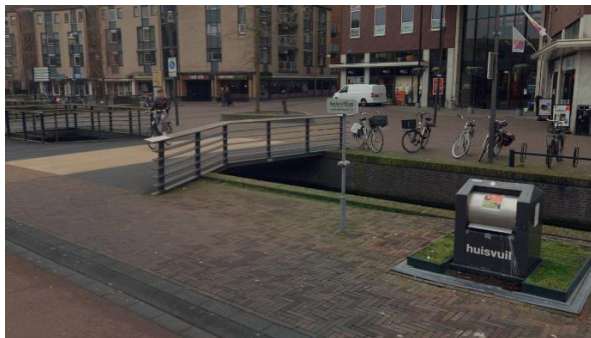
Locatie F, vaste beplanting