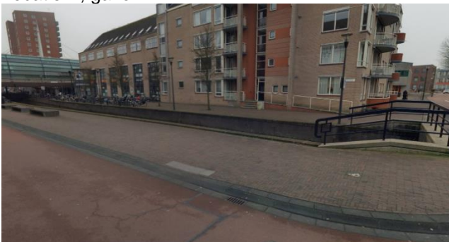
Locatie B, vaste beplanting en boom