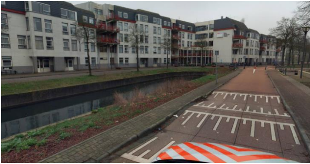
Locatie A, gazon