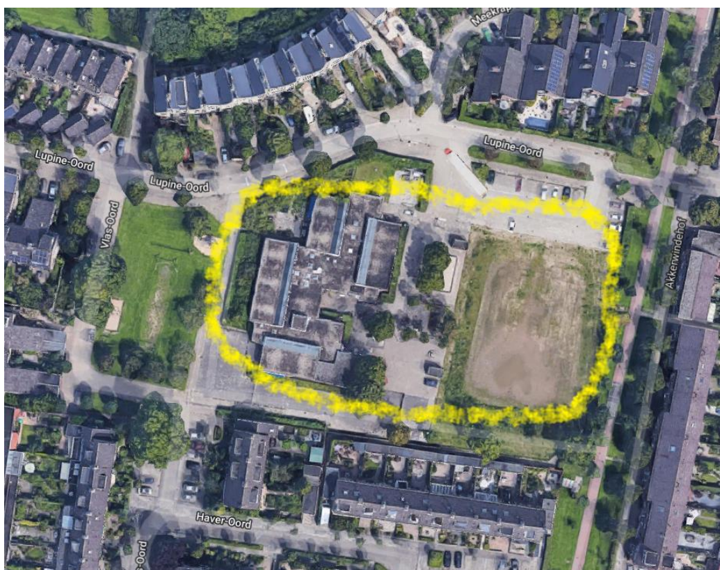
afbeelding 2) Te ontwikkelen gebied Wegwijzer Den Oord

Door het verdwijnen van de school en de sporthal is er ruimte vrij binnen de wijk. Voor de gemeente is dit dan ook een goede kans om wonen op deze locatie, dicht bij het centrum van Houten, mogelijk te maken.