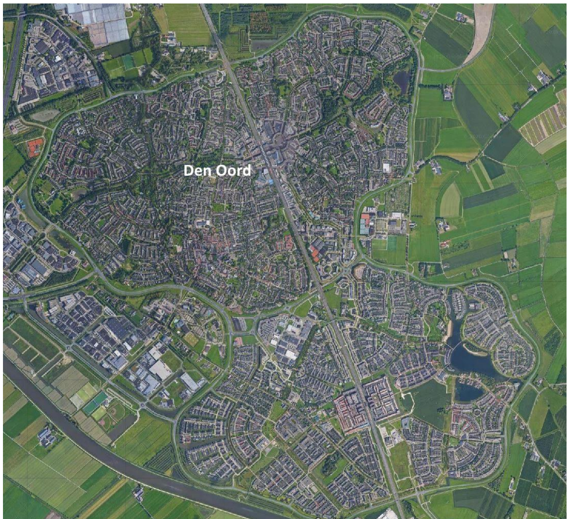
afbeelding 1) Overzicht Houten met locatie wijk Den Oord

In het noordwestelijk deel van Houten tegen centrum gelegen, vinden we de wijk Den Oord. Binnen de wijk bevindt zich een terrein waarop een school en een sporthal gevestigd waren. Zowel de school als de sporthal zijn inmiddels niet meer in gebruik en gesloopt. Het terrein dat hiermee vrij is gekomen, wil de gemeente gebruiken voor woningbouw. Het terrein staat bekend onder de naam Wegwijzer Den Oord. Zo duiden we het ook in de rest van dit document aan.