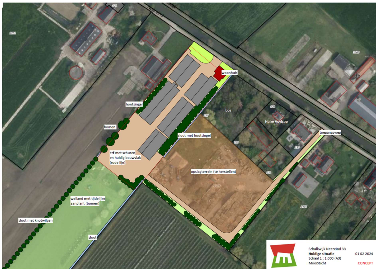
Figuur 2: Weergave (concept) van beoogde indeling c.q. gebruik. Het perceel 1579 (met tekst Opslagterrein (te herstellen)) wordt landschappelijk ingericht c.q. een meerwaarde gecreëerd.

Ten opzichte van de bestaande situatie op het Neereind 33 én het perceel 1579 is een afbouw en reductie van de activiteiten aan de Neereind te realiseren doordat initiatiefnemer beschikt over een tweetal concrete bedrijfslocaties voor grootschalige op- en overslag en be- en verwerkingsactiviteiten van houtachtig materiaal etc., te weten in Odijk (Defensieweg) en in Enspijk (gemeente Geldermalsen). Deze locaties, in totaal 8 hectare, beschikken over voldoende mogelijkheden en gebruikruimte voor de grote bulkstromen en bewerkingsactiviteiten.