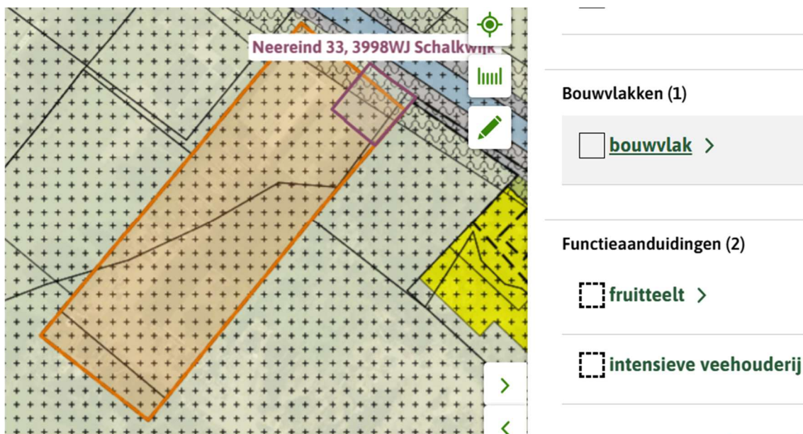
Figuur 1: Uitsnede OP Eiland van Schalkwijk, Neereind 33; bestemming Agrarisch, functieaanduidingen 'fruitteelt' en 'intensieve veehouderij'. Bouwvlak (circa 8.500 m 2 )

Inzake de toegangsweg wordt opgemerkt dat deze – gedeeltelijk – belast is met recht van overpad ten behoeve van aangrenzende eigenaren van objecten of landbouwgronden.