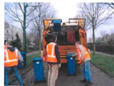
Vorig jaar hielpen ruim 1.400 vrijwilligers van OPA om de papierkliko's te legen.

In alle kernen van de gemeente Houten zamelen de vrijwilligers van scholen en kerken het oud papier in. In Houten en 't Goy gebeurt dit met blauwe papierkliko's en in Schaalkwijk en Tull en 't Waal op de "ouderwetse" manier met dozen en zakken. In die dorpen staat ook een grote verzamelcontainer waarin de dorpsbewoners hun papier kwijt kunnen. De komst van de papierkliko heeft ervoor gezorgd dat de vrijwilligers maar liefst één miljoen kilo papier per jaar extra ophalen!